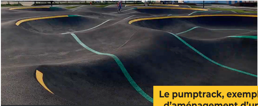
Le pumptrack, exemple d'aménagement d'un espace public